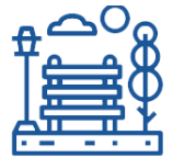
PARQUES Y ESPACIOS VERDES