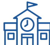
ESPACIOS Y EVENTOS COMUNITARIOS