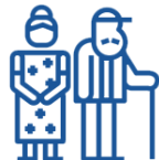
SERVICIOS PARA LOS JÓVENES Y ADULTOS MAYORES