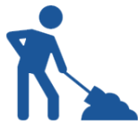
CALLES Y ACERAS